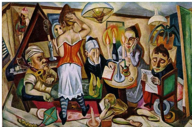
М.Бекман 1. Ночь. 1918- 19 гг.