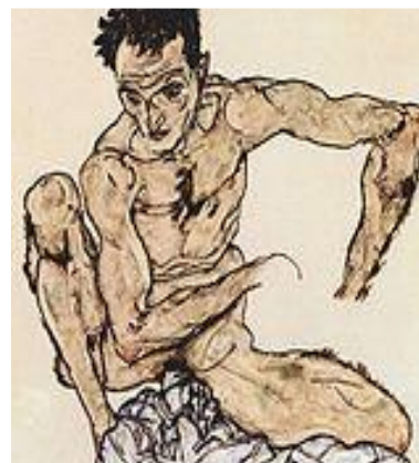
Автопортрет, 1913. Национальный музей, Стокгольм

В психиатрии существует симптом, именуемый «Praesox-Gefuhl», описанный немецким врачом О. Рюмке, – специфическое смутное, трудноописуемое ощущение , возникающее у психиатра с большим опытом работы при беседе с пациентом, недавно заболевшим шизофренией. Патологическая симптоматика такого человека ещё не стала очевидной и бесспорной: яркие нарушения мышления ещё не выражены, явные нелепости в поведении ещё отсутствуют, патология имеет несколько бытовой, даже обыденный оттенок, маскирующийся под весьма неспецифические и неопределённые симптомы; но какие-то, почти незначительные несообразности в речи, пластике или поведении больного