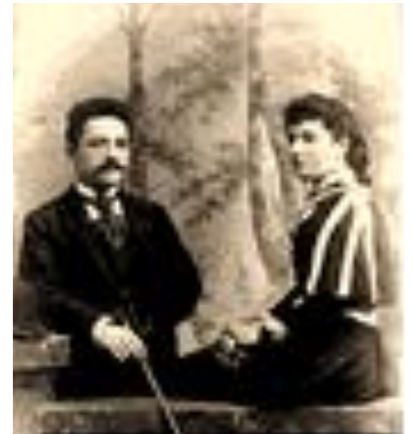
Родители Дж. Гершвина