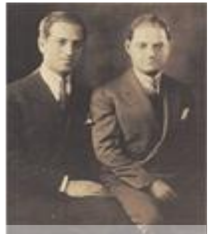
Джордж и Айра Гершвин

Джордж Гершвин был вторым ребёнком в семье еврейских переселенцев из России. Его старший брат Айра Гершвин, ставший впоследствии автором большинства песен Дж. Гершвина), был аккуратным еврейским мальчиком, предпочитавшим обычным играм чтение. Он методично вёл список прочитанных им книг. Джордж же был большим любителем погонять мяч, подраться и, видимо, ему нередко приходилось слышать упрёки родителей по поводу своих разбитых башмаков: читать же книги он терпеть не мог. Айра учился хорошо, Джордж к учёбе был, мягко говоря, безразличен. Его успехи только-только позволяли ему переходить из класса в класс. А когда родителей приглашали